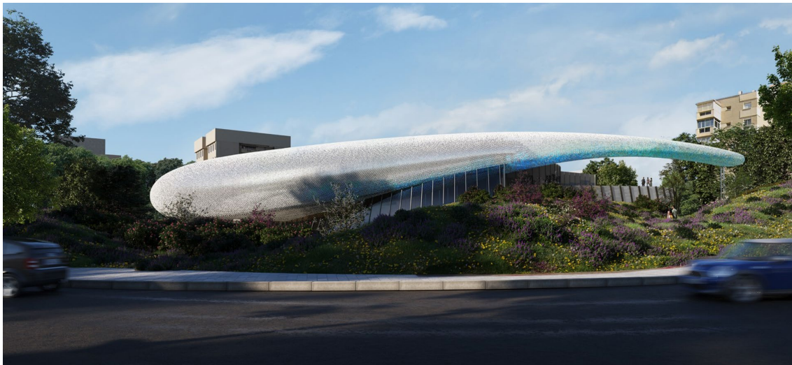
Cubierta en forma de gota de agua de CaixaForum Málaga, de día

El nuevo edificio estará situado en la estratégica plaza Manuel Azaña, en una de las entradas más visibles de la ciudad, que enlaza directamente con la avenida Andalucía. De esta forma, con CaixaForum no solo se busca complementar la oferta cultural existente y dotar al entorno de nuevas áreas verdes, sino que, al mismo tiempo, se aspira a convertir la zona en un nuevo polo revitalizador, tanto físico como social.