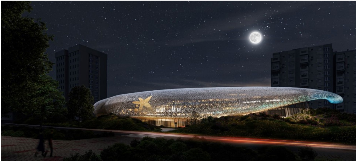
Cubierta en forma de gota de agua del CaixaForum Málaga, de noche

espacio educativo, una cafetería restaurante y una tienda librería en la planta baja, así como un aparcamiento subterráneo.